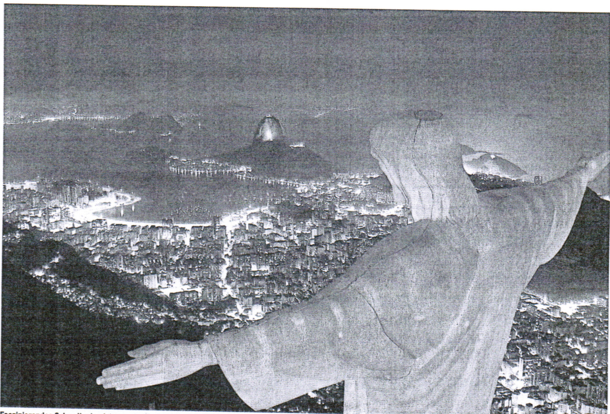
Finanzierendes Schwellenland: Innovative Technologien sind hilfreich für einen Marktzugang.

An 24 Standorten werden zurzeit in Brasilien Werften gebaut oder modernisiert. Von Oltershausen: „Das geplante Neubau-Programm bietet