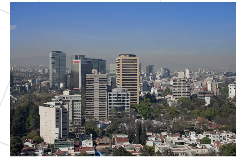
Blick auf die Skyline von Polanco

Mexiko stellt die zweitgrößte Volkswirtschaft Lateinamerikas nach Brasilien dar und zählt zu den am besten entwickelten Ländern des Subkontinents. Nachdem sein Wirtschaftswachstum in den vergangenen Jahren rückläufig war, erwarten Experten für 2014 wieder ein Plus von 3 Prozent. Mexiko verfügt über eine leistungsfähige Industriestruktur und genießt durch den NAFTA-Raum einen privilegierten Zugang zum US-Markt. Zudem hat der mexikanische Gesetzgeber in der jüngeren Vergangenheit mit einer Reihe von tiefgreifenden Reformen – u.a. im Bildungswesen, im Arbeitsrecht sowie im Telekommunikations- und Energiesektor – bedeutende Weichenstellungen vorgenommen, die die Wachstumskräfte des Landes stärken werden.