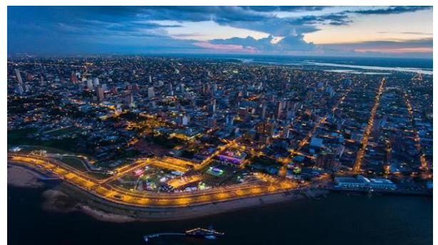
Asunción, Hauptstadt und wichtigstes Wirtschafts- und Logistikzentrum des Landes

Paraguay ist ein Binnenland und liegt strategisch zwischen den großen Ländern des Kontinents, Argentinien und Brasilien, sowie Bolivien. Stark von der landwirtschaftlichen Produktion abhängig, konnte es in den letzten Jahren eine für die Region beispielhafte wirtschaftliche Stabilität erreichen. Das Land wächst dank seiner exportorientierten Wirtschaft und trotz der Schwierigkeiten seiner Nachbarn seit 15 Jahren mit einer Rate von durchschnittlich 4,5 % pro Jahr. Hauptexportgüter sind Agrarprodukte, Fleisch und grüne Energie aus Paraguays riesigen Wasserkraftwerken. Im Jahr 2020 sank das BIP, gebremst durch die Pandemie, nur um 0,6 % und für 2021 prognostiziert der IWF eine Rückkehr auf den Wachstumspfad mit einem Plus von 4 %.